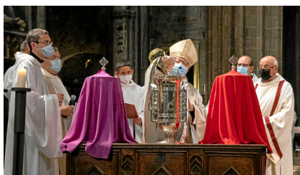
Missa Crismal (30/03)