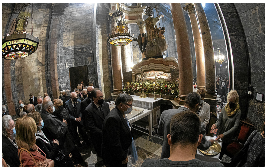
Fidels recollint el cotó beneït a la capella de Sant Narcís. Autor: Àngel Almazan.