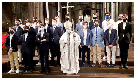
Col·legi Bell-lloc B (Girona), 25 d'abril