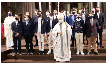
Col·legi Bell-lloc C (Girona), 25 d'abril