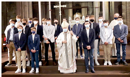
Col·legi Bell-lloc A (Girona), 25 d'abril