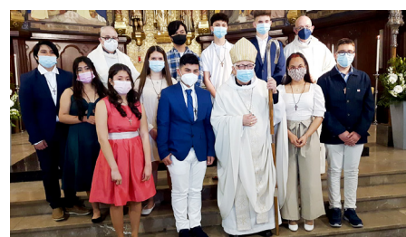
Palafrugell, 2 de maig