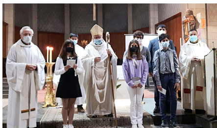
Canet de Mar, 10 d'abril