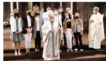
Col·legi Les Alzines A (Girona), 2 de maig