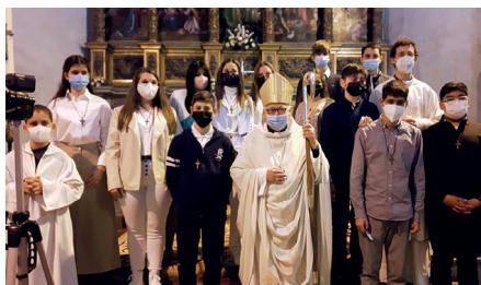
Palamós, 11 d'abril