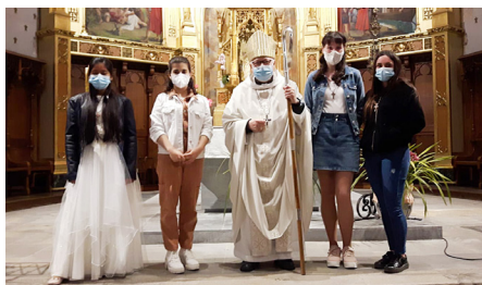
Lagostera, 17 d'abril