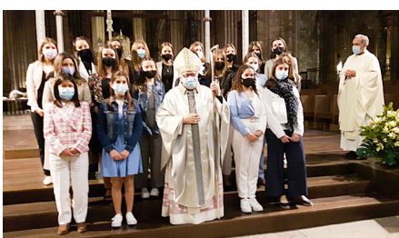
Col·legi Les Alzines C (Girona), 2 de maig