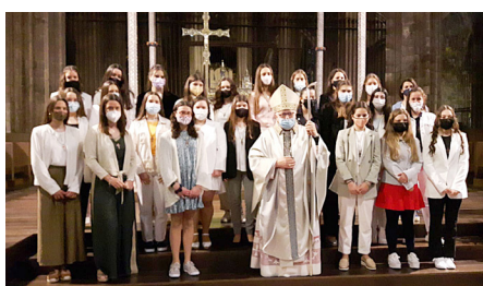
Col·legi Les Alzines B (Girona), 2 de maig