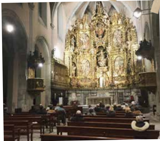
Recés-xerrada de Quaresma a l'església d'Arenys de Mar.