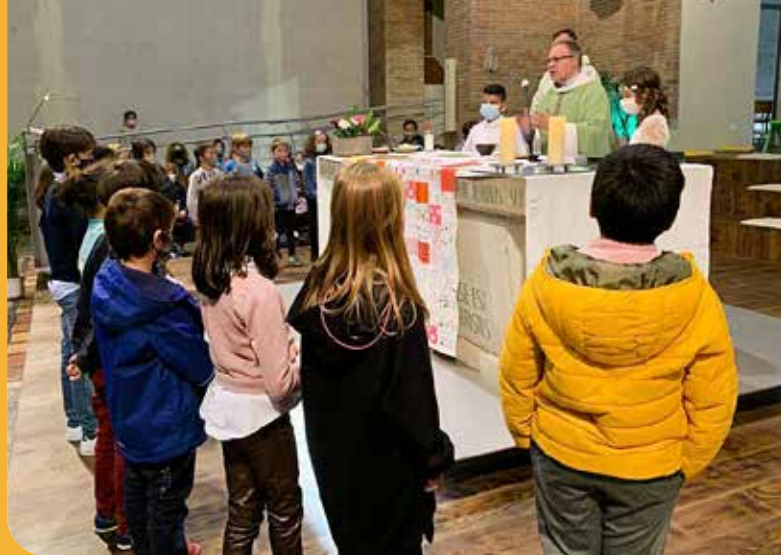
Missa de la catequesi a l'església de Sant Josep de Girona.