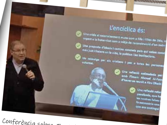
Conferència sobre Fratelli tutti a l'església del Mercadal de Girona.