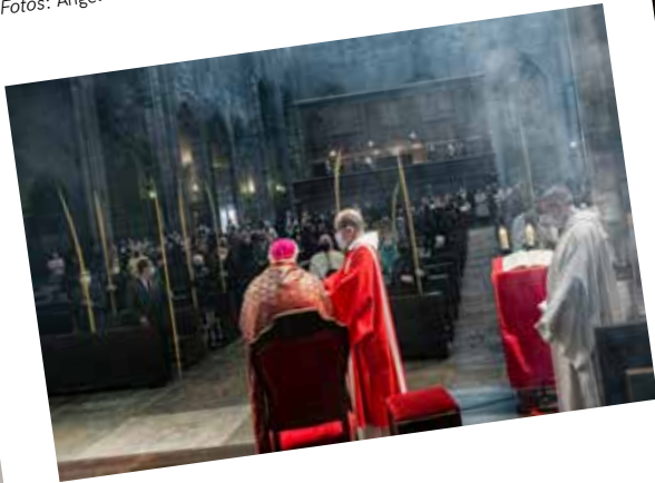
Diumenge de Rams.