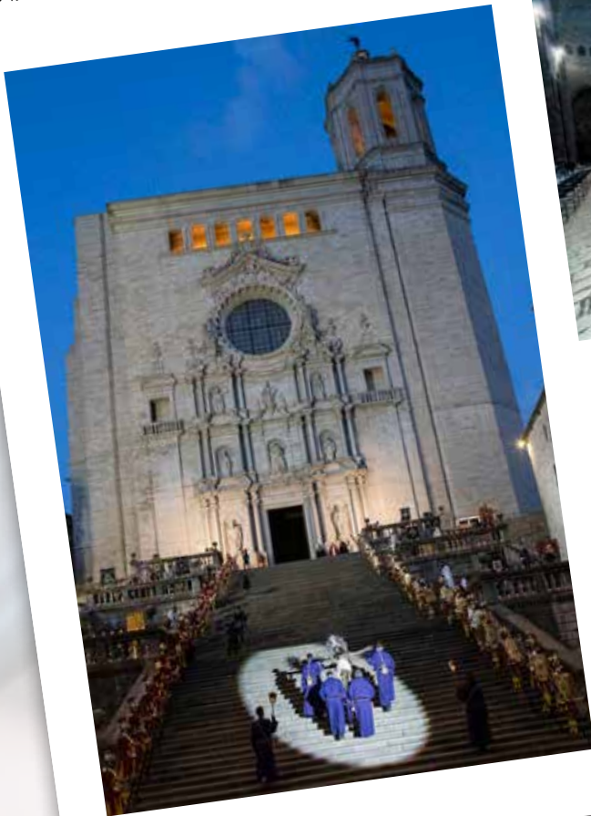
Veneració de la Creu.