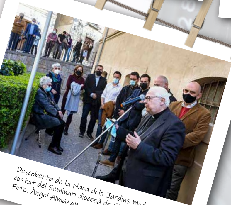
Descoberta de la plaça dels Jardins Modest Prats, al costat del Seminari diocesà de Girona.