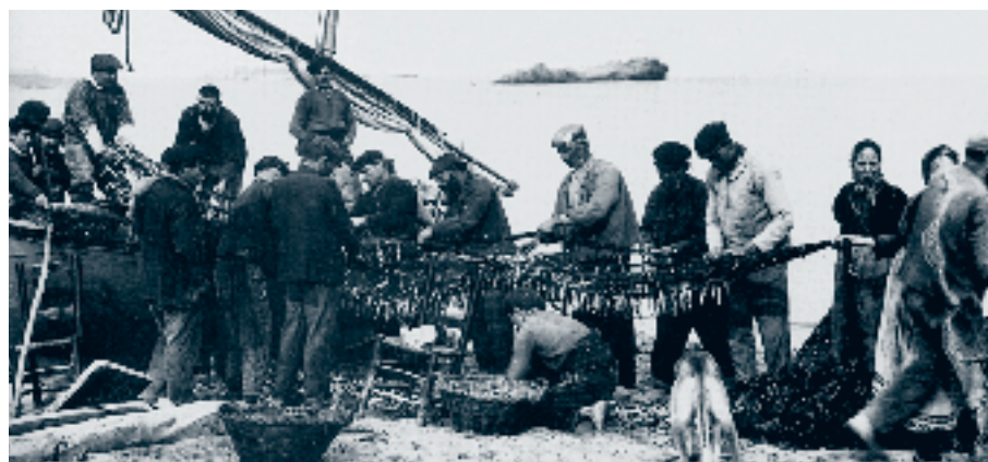
"...aquelles grans xarxes que, tirades a l'aigua, arpleguen de tot. Quan són plenes, les treuen a la platja, s'asseuen i recullen en coves tot allò que és bo, i llencen allò que és dolent. Igualment passarà a la fi del món..."

¿Ho heu entès tot això?". Li responnen: "Sí que ho hem entès". Ell els digué: "Mireu, doncs: Els mestres de la Llei que es fan deixebles del Regne del cel són com aquells caps de casa que treuen del seu cofre joies modernes i antigues".