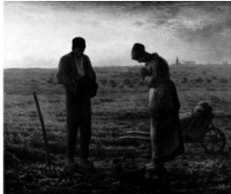
Pintura de Jean François Millet, titulada "L'Àngelus" (1859)

La campana és un instrument de percussió que es va començar a desenvolupar durant èpoques prehistòriques a diferents parts del món. Amb el pas dels segles se'n va anar modificant la forma per tal de perfeccionar-ne la qualitat del so. La campana tal i com la coneixem avui dia començà a aparèixer a principis del mil·lenni II; moment en què l'Església i la societat l'adoptà com a mitjà de comunicació per excel·lència.