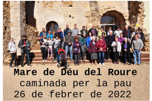
Mare de Déu del Roure caminada per la pau 26 de febrer de 2022

☎ 972 53 55 13 o al 628 072 095. e-mail: perelluis.aymerich@gmail.com