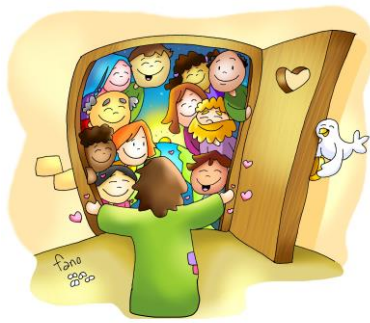
Tota la Ciutat s'haVia aplegat davant la porta