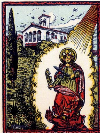
Festa Patronal: 20 de Juliol

PREVILEGIS CONCEDITS: L'Excm. i Rvdm. Sr. Bisbe de la diòcesis concedeix 100 dies d'Indulgència als qui devotament cantin aquests goigs o part notable dels mateixos. Complint les condicions establertes i visitant la Capella de Sta. Margarida, hi ha catorze dies a l'any que s'hi pot guanyar Indulgència Plenària. Pius VI, el do d'Altar Sagrat; Pius IX, el de Capella Sagrada i, demés, Indulgència Plenària a l'hora de la mort per a tots els fills de La Dou.