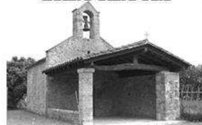
CORNELLÀ DE TERRI