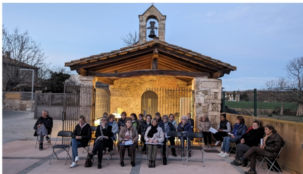
Rosari davant la capella de Sant Antoni de Cornellà dimecres 17 de gener