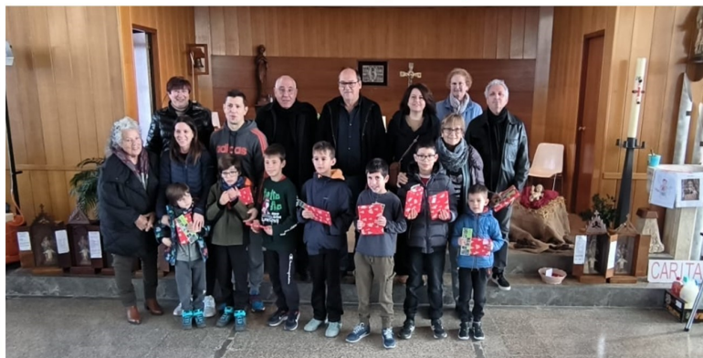
Entrega de premis del 40è Concurs de Pessebres de Fontoberta, Diumenge 14 de gener