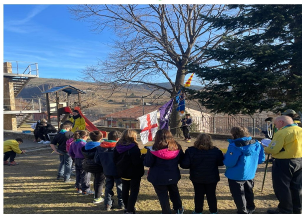
Sortida dels Llops i Daines a Molló el Dissabte 27 de gener. Pujada de Banderes abans de la Celebració de la Paraula