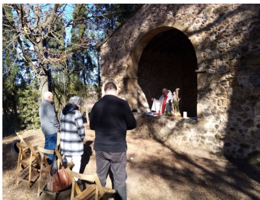
Missa davant la capella de Sant Sebastià d'Ollers, el diumenge 21 de gener