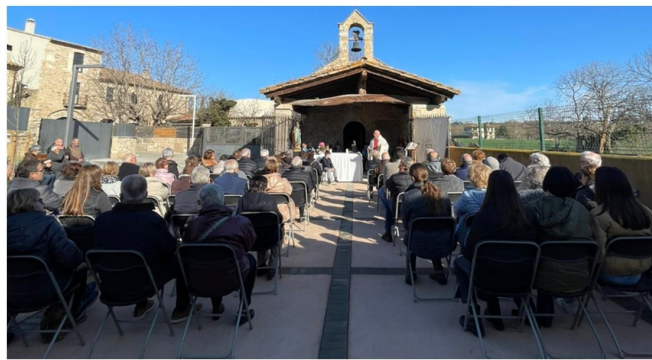
Eucaristia davant la capella de Sant Antoni de Cornellà, diumenge 21 de gener