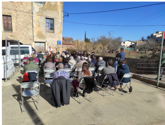
Missa de Sant Sebastià de Serinyà el diumenge 21 de gener