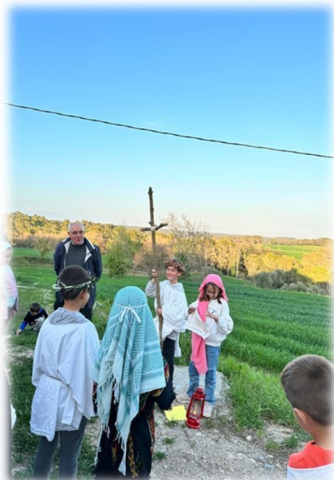
VIA CRUCIS AMB ELS NENS DE CATEQUESI DE CORNELLÀ—FONTCOBERTA—SERINYÀ el divendres 15 de març a la Farrés a la Mare de Déu de la Font a les 18 h