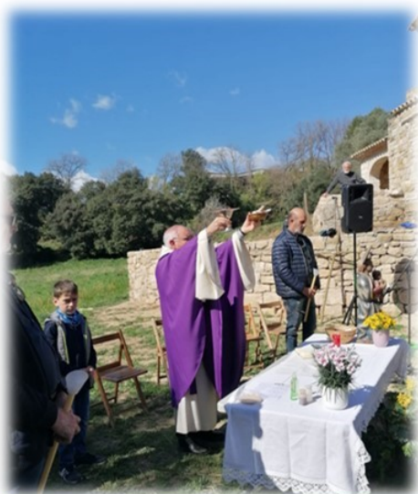
APLEC DE LA MARE DE DEU DE LA FONT Missa a les 11 del diumenge 17 de març. Funció a les 3 h