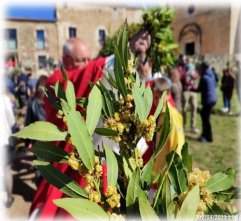
BENEDICCIÓ I MISSA DE RAMS EL DIUMENGE 24 DE MARÇ A les 10 a Vilavenut i a Cornellà; a les 11 a Fontcoberta; a les 12 a Serinyà i a l'1 al Santuari de la Mare de Déu del Mont