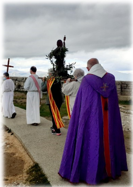
ROMERIA DE BANYOLES I APLEC DE SANT BERNAT MENTHON A LA MARE DE DEU DEL MONT, Diumenge 10 de març a les 13 h