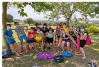
Final de curs dels Ràngers: pinball al bosc de Ca l'Oriol el dissabte 12 juny

CAMPS D'ESTIU DELS ESCOLTES Els Pioners aniran d'Ull de Ter al Costabona. Els Ràngers faran un campament a la Bisbal i els Llobatons a Beget.