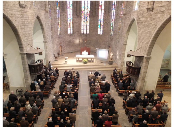
Santa Maria dels Turers, Banyoles 2012

(Álvaro Lobo, sj https://pastoralsj.org/ )