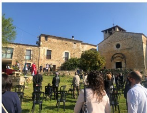
Rams a Fontcoberta