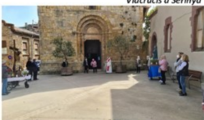
Viacrucis a Serinyà