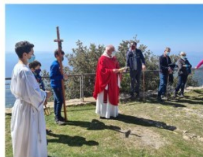
Rams al Stri de la Mare de Déu del Mont