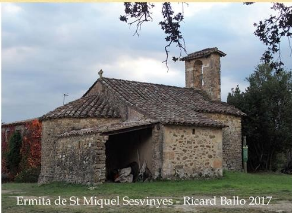
Ermита de St Miquel Sesvinyes - Ricard Ballo 2017