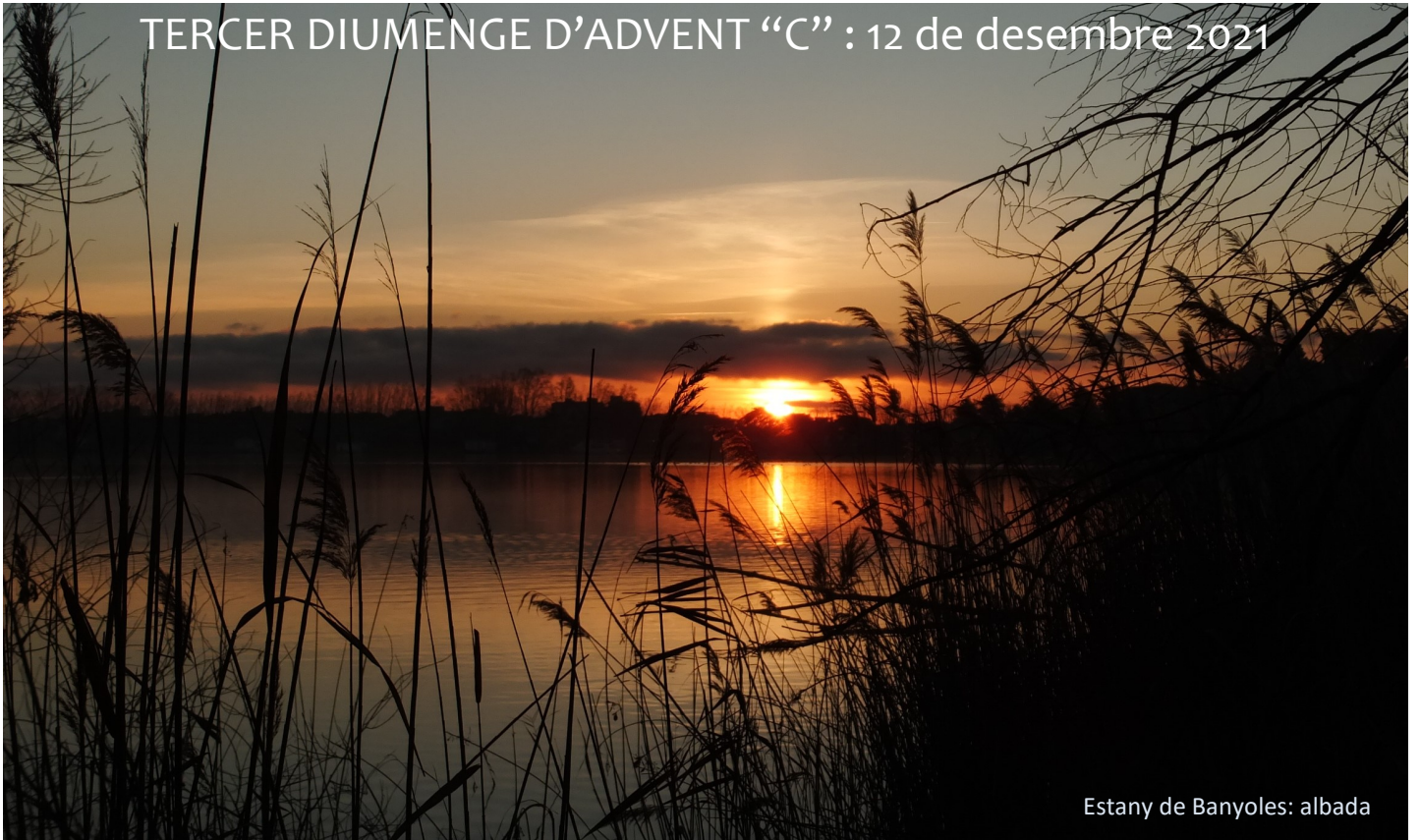
Estany de Banyoles: albada

Les lectures de diumenge passat intentaven transmetre'ns alegria i joia, perquè la salvació de Déu la tenim a tocar. Avui les lectures que hem escoltat insisteixen en el mateix tema: " Crida de goig ciutat de Sió... Alegra't i celebra-ho de tot cor " (1 a Lectura) " Poble de Sió, aclama al Senyor ple de goig " (Salm) " Viviu sempre contents en el Senyor " (2 a Lectura) Finalment a l'Evangeli diu que Joan Baptista anunciava la Bona Nova, i una bona notícia sempre porta joia. La primera lectura i el salm ens recorden que Déu, malgrat el pecat de les persones, sempre ens estima. Si som estimats per Déu hi ha motiu per celebrar-ho i alegrar-nos-en. Aplicant aquesta afirmació a la nostra realitat ens adonarem que l'església, tantes vegades pecadora, segueix gaudint de l'amor de Déu, perquè Ell continua estimant-la sempre.