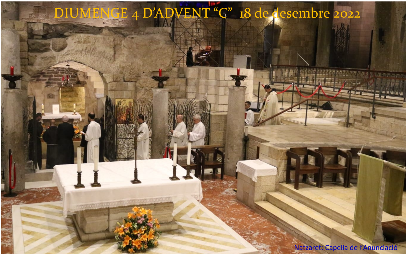
Nazaret: Capella de l'Anunciació

DIUMENGE 4 D'ADVENT "C" 18 de desembre 2022