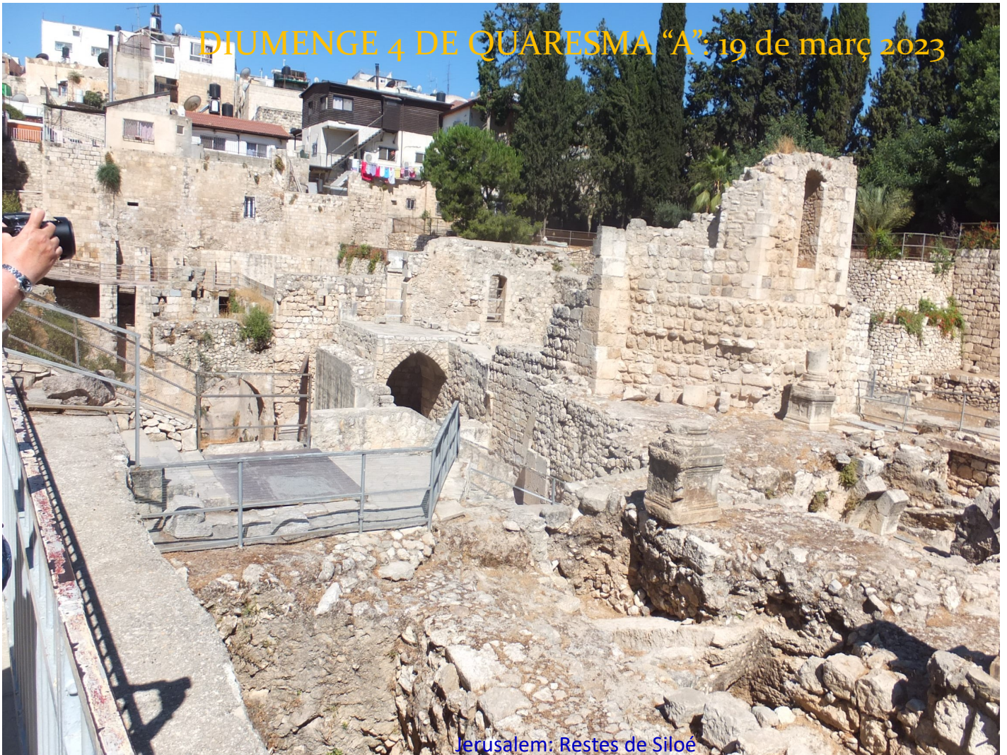
Jerusalem: Restes de Siloé

DIUMENGE 4 DE QUARESMA "A": 19 de març 2023