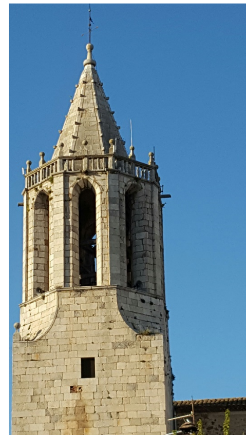
Església parroquial dedicada a Sant Martí