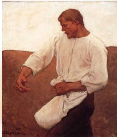
El sembrador . Albin Egger 1908