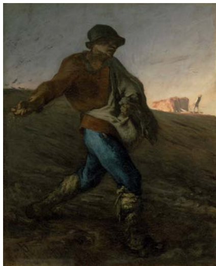
El sembrador · Jean François Millet 1850