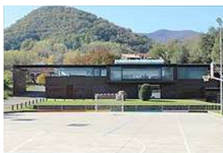
Centre Cívic de Riudaura des de la pista poliesportiva

ESCRIVIA A PRINCIPIS DEL SEGLE XX J. BOTET i SISÓ