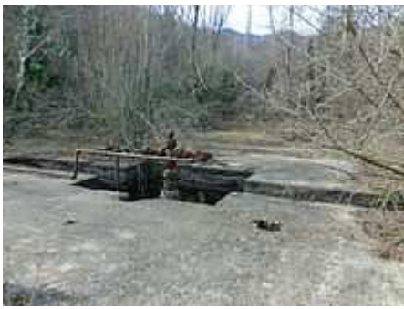
Antic pou de petroli prop del Mas Fajula

El poble de Riudaura sofrí durant els anys 60 un sotrac important amb el descobriment de petroli dins el seu terme, les cates van revelar només indicis i que es trobava molt per sota d'una bossa de gas que tampoc era rendible d'explotar, el moviment de personal que es va produir no va suposar un impuls econòmic pel poble.