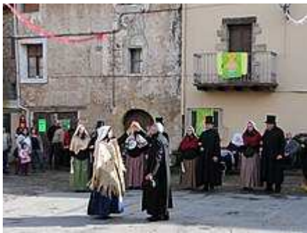
Ball del Gambeto de Riudaura

La Festa del Roser se celebra el diumenge de Pentecosta. Una data que varia anualment, ja que depèn del cicle lunar, i sol ser al maig o juny. Malgrat que inicialment la Festa del Roser era una festivitat religiosa, actualment, en resta només la celebració de l'Ofici Solemne el diumenge. L'acte central de festa és el Ball del Gambeto, que es realitza a la plaça homònima el diumenge a la tarda. Es creu que els seus orígens es remunten a l'antic monestir de Riudaura.