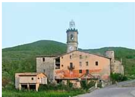
Església de Santa Maria de Riudaura