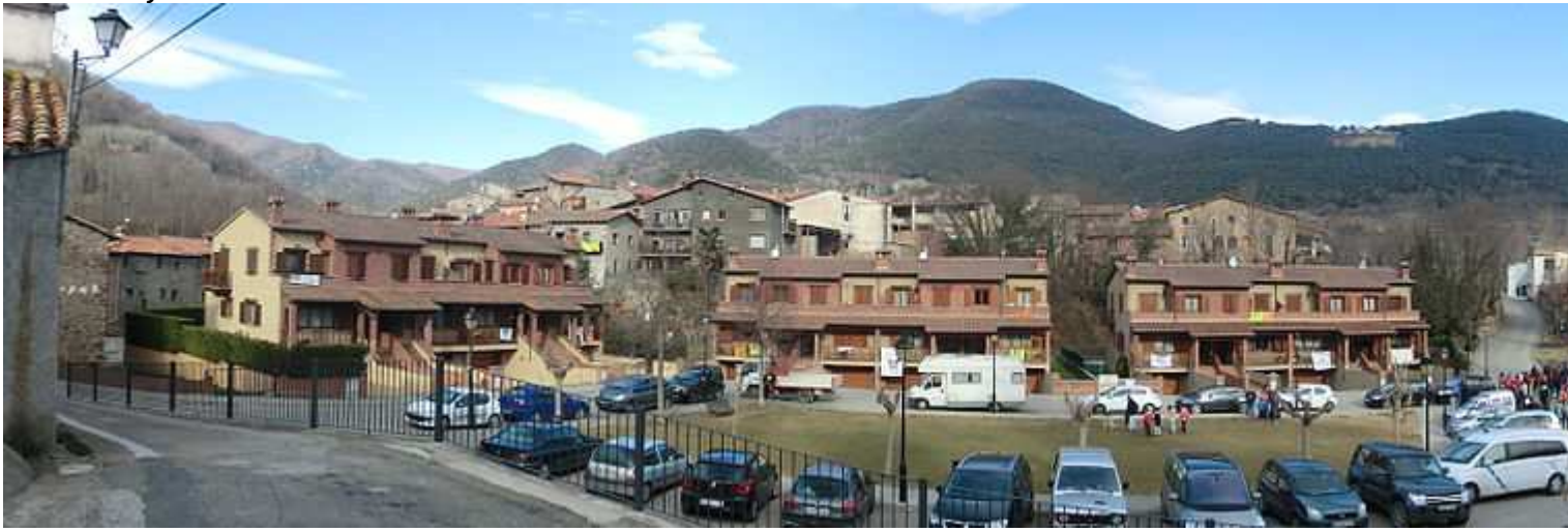
Pla dels Tiradors de Riudaura amb pancartes contra la fracturació hidràulica en l'inici d'una caminada popular contra aquesta tècnica.

L'octubre de 2012 l'empresa Teredo Oils Limited va rebre l'autorització de la Generalitat de Catalunya per realitzar la perforació de dos pous a Riudaura amb la finalitat d'investigar sobre l'existència d'hidrocarburs del subsòl. De seguida es va crear una forta oposició a les prospeccions, ja que se sospitava que en cas de trobar gas o petroli l'empresa l'extrauria mitjançant la tècnica de la fracturació hidràulica o fracking. La població de Riudaura i de la resta de municipis afectats es va mobilitzar i es va crear la Plataforma Riudaura Junts contra el Fracking. Al 2013, diversos partits polítics amb representació al Parlament de Catalunya van signar el Compromís del Bover a la masia homònima propera a un dels pous oberts als anys 60, per prohibir la fracturació hidràulica a Catalunya.