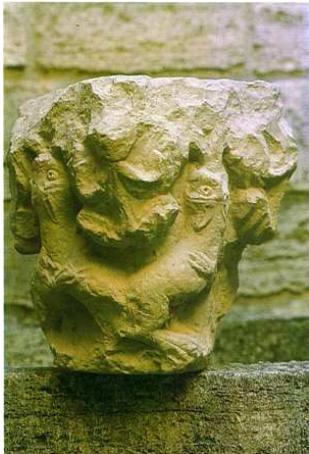
Capitell procedent probablement d'aquesta església, actualment conservat al Museu de Banyoles, on ingressà l'any 1958; és catalogat amb el núm. 84. F. TUR

L'interès de la peça està bàsicament en la seva decoració, que es desenvolupa de manera simètrica per cada cara: així, es repeteix en cadascuna un doble cos de quadrúpede amb un únic cap orientat vers la part superior i mossegant un element vegetal, sembla que una tija. Aquesta enllaça amb altres motius que ocupen els angles superiors i que configuren una palmeta invertida centrada per una fruita. El nivell de qualitat de la peça és notable, i destaca l'interès pels detalls, com el de les potes davanteres agafades al cos oposat o la fusió dels dorsos de cares contigües. Les formes destaquen del fons en un relleu convincent, tot i algunes irregularitats compositives.