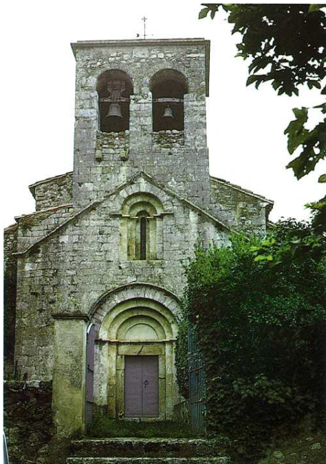
Vista exterior de l'església amb la façana de ponent, on hi ha oberta la porta d'entrada. A. BORBONET

La nau és coberta per una volta de canó seguit i l'absis per una volta de mig cercle. Aquest és situat a un nivell superior que la nau; la diferència d'alçada és salvada per dos graons.