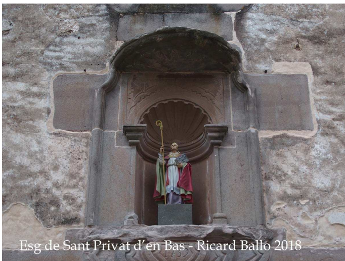
Esg de Sant Privat d'en Bas