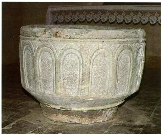
Pica baptismal conservada a l'interior de l'església.

L'església de Sant Privat conserva una pica baptismal d'immersió.