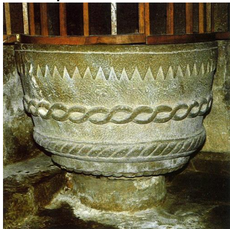
Pica baptismal conservada a l'interior de l'església. A. MARTÍ

A l'extrem nord-occidental de l'església, al costat de A l'angle del mur, sota el cor, es conserva una pica baptismal de tradició romànica. Es tracta d'una peça de pedra calcària, de forma troncocònica i amb la base escapçada, molt malmesa a la part inferior.