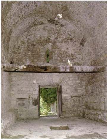
Un aspecte de l'interior de l'església des de la capçalera vers ponent. J. M. MELCIÓ

Aquesta és, segons R. Sala i N. Puigdevall (El romànic de l'Alta Garrotxa), l'única transformació haguda a l'església. Aquests autors la daten, tenint en compte la forma rectangular sense absis i el campanar d'espada de doble obertura que s'aixeca damunt la façana de ponent, al segle XII o al començament del XIII. Aquesta datació pot ésser confirmada pel tipus d'aparell que presenta: carreus de mida regular, ordenats en filades, com la majoria d'esglésies rurals de la Garrotxa. Pel que fa a l'absis d'estructura rectangular veiem que, en altres casos que també es presenta així, normalment és degut a una substitució de l'absis primitiu semicircular; aquí, però, l'anàlisi dels murs i de la planta no sembla demostrar aquesta possibilitat. Aquest tipus d'església sense absis diferenciat apareix també a la Vall del Bac, a Sant Miquel de la Torre, i en algunes esglésies empordaneses com les de Santa Maria de Vilafant o Sant Vicenç de Vilamalla, que poden ésser datades al segle XIII, en un clar exemple de l'esgotament de les formes romàniques davant el món gòtic. (EBC-JAA)