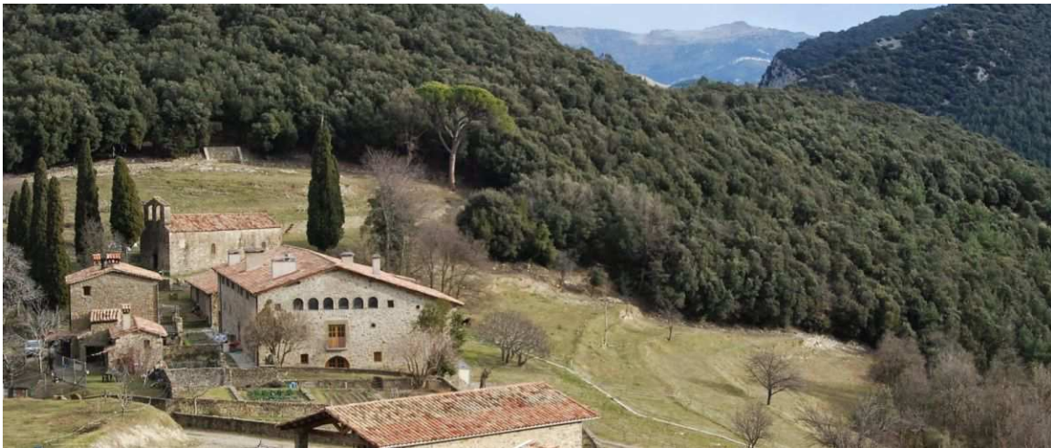
Vista general del casal de Llongarriu