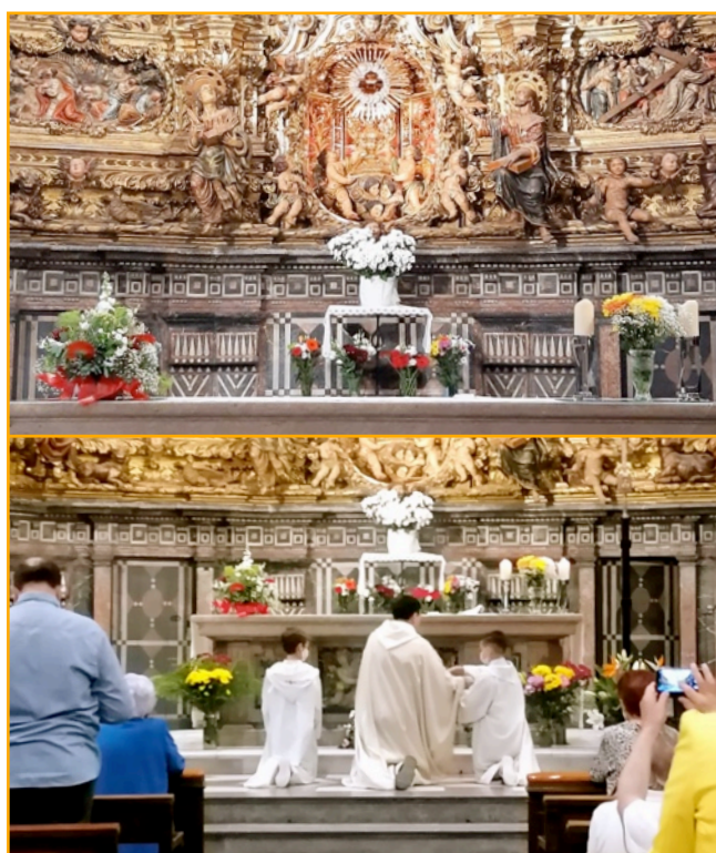
Corpus 2021 a Arenys de Mar