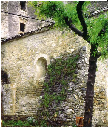
Aspecte que ofereix un dels murs exteriors de l'edifici.