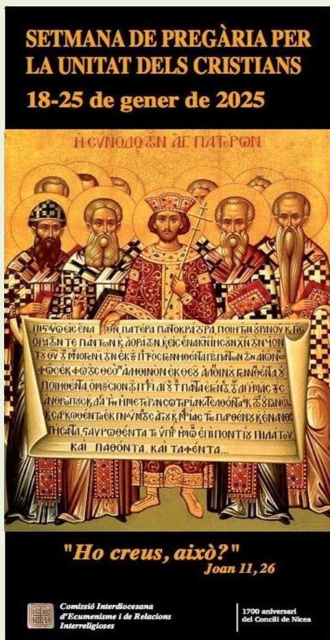
Cartell imatge: icona commemorativa del Primer Concili de Nicea