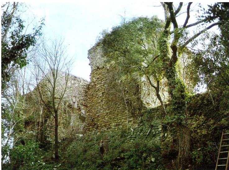
Façana septentrional del recinte exterior de la fortificació. J. BOLÒS

El castell de Sales és un edifici que ha sofert nombroses transformacions, però que, malgrat això, encara conserva molts dels elements originals o, si més no, permet que amb facilitat ens imaginem com era llur distribució. La construcció central, allò que podríem anomenar la torre mestra, és un edifici gairebé de planta quadrada, situat al mig de les construccions que es conserven actualment. Té, a l’exterior, d’est a oest, una longitud de 6,45 m i, de nord a sud, una llargada de 6,80 m. Els murs al primer pis tenen un gruix que oscil·la entre els 95 i els 100 cm; en un nivell inferior sembla que arriben a tenir un gruix de 195 cm.