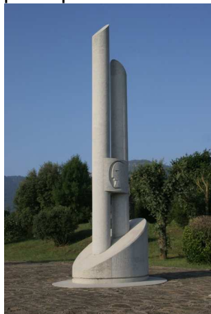
Monument a Francesc de Verntallat

Destaca per les cases amb les corresponents eres al davant, ben restaurades i arrengrerades l'una al costat de l'altra. Si la visita es fa a la primavera o l'estiu, les llargues balconades de fusta mostren centenars de testos amb geranis i altres flors, conformant així una mena de jardí urbà de notable impacte visual; fets meritoris que han permès al poble d'Hostalets ser catalogat com a conjunt històric-artístic. Aixecant la mirada a les muntanyes del davant, criden l'atenció les cingleres de Falgars, presidides per la silueta de l'ermita de Sant Miquel de Falgars o Castelló. Diferents itineraris ens permeten pujar-hi, des d'on domina una panoràmica impressionant sobre el pla i que arriba fins la ratlla de mar.