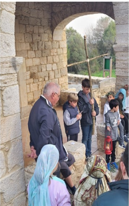
Via Crucis amb els nòis i noies de la Catequesi a la MdD de la Font 24-3-2023

Via- Crucis a 2/4 de 10 a Melianta; a les 10 a Cornellà, a 2/4 de 12 a Serinyà i a 2/4 de 9 a Fontcoberta