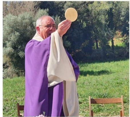
Missa a la MdD de la Font 26-3-2023