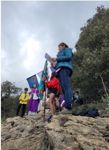
Missa a l'Oratori de Salve Regina 19-3-2023