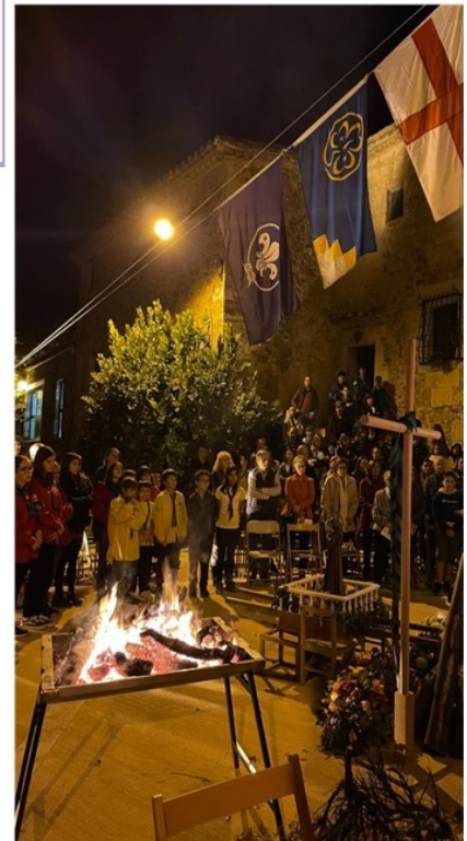
Missa animada pels escoltes a Fontcoberta 12-11-2022

MISSA a les 9 a VILAMARI; a les 10 MISSA a VILAVENUT, a les 11 MISSA a CORNELLÀ i a les 11 CEL. PARaula a MELIANTA; a 2/4 d'1 MISSA al COLLELL i a l'1 CEL. PARaula al MONT