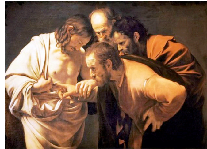
Caravaggio. La incredulitat de sant Tomàs, apòstol . Palau de Sanssouci, Potsdam, Alemanya

“FELIÇOS ELS QUI CREURAN SENSE HAVER VIST!”