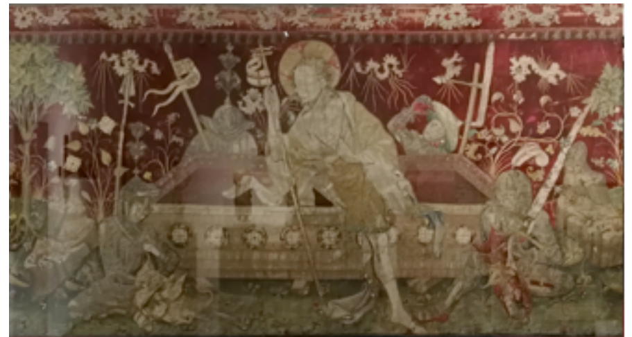
Frontal de la Resurrecció. Basílica de Sant Feliu de Girona. Dipositat al Museu Diocesà

« REALMENT EL SENYOR HA RESSUSCITAT, AL·LELUIA! »