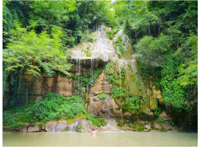
Salt del roure

Joanetes va ser municipi independent fins el 1970, que juntament amb d'altres pobles de la Vall varen formar el municipi de La Vall d'en Bas.