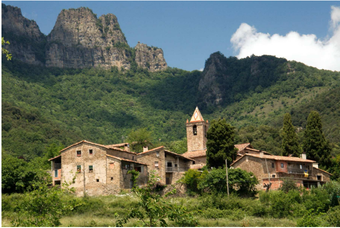
Nucli de Joanetes