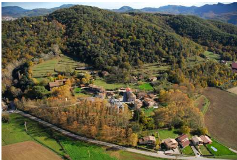
Nucli de l'església i safareig comunitari

Segons Botet i Sisó a principis del segle XX tenia 465 habitants. Escola elemental incompleta d'assistència mixta.