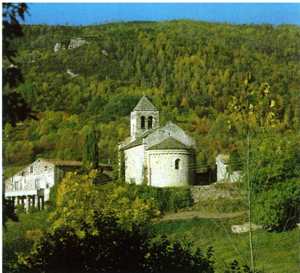
Vista exterior de l'església des de llevant.

L'església de Sant Feliu és la titular de Rocabruna, poble de l'antic municipi de Beget, el qual l'any 1969 fou incorporat al de Camprodon. El poble és a la capçalera del riu de Beget, el qual en aquest sector és anomenat riu de Rocabruna, al vessant meridional del Montfalgars. L'església, situada a 972 m d'altitud, és al sector nord-occidental, vora el coll de la Boixeda, a l'interfluvi de la riera de Rocabruna i del torrent de les Arçoles, els quals, precisament, s'uneixen sota la muntanya on es troba el temple.