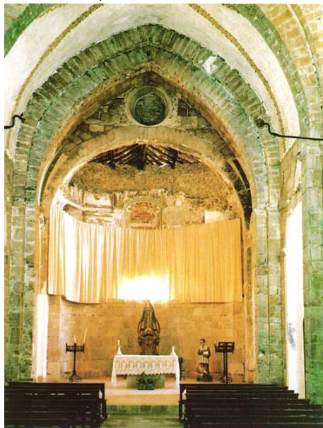
Vista de l'interior de l'església amb la capçalera. E. PABLO

ponent es dreça el campanar, una massissa espadanya de dos ulls, desfigurada pel sobrealçament de la nau, ambla construcció d'unes golfes, que també abasten l'absis.