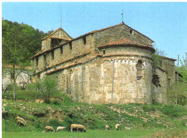
Una vista exterior de l'església des del costat de sud-est. J. M. MELCIÓ

L'església de la Mare de Déu dels Arcs és un edifici d'una nau, coberta amb volta de canó, de perfil apuntat, reforçada per tres arcs torals, també apuntats, que arrenquen de sengles pilars adossats als murs perimetrals. Els dos arcs més propers a la capçalera i llurs pilars presenten un acusat ressalt.