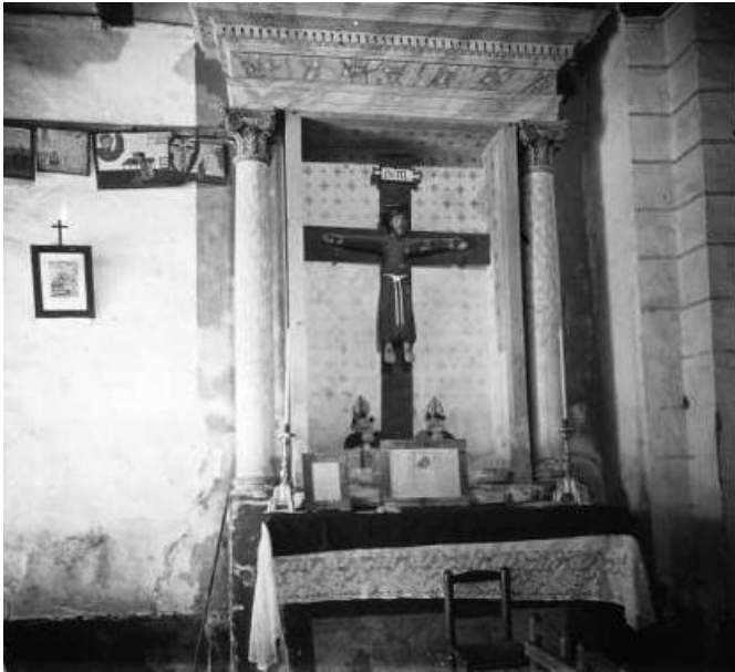
Interior església avui